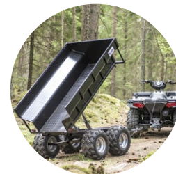
Przyczepa ATV 1420 kg

W naszym zapleczu znajdują się również wozidła samozaładowcze oraz ubijarki.