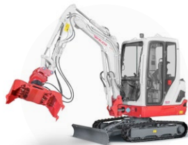
Koparki: Takeuchi TB 225 Takeuchi TB 240

Dzięki doświadczeniu naszych pracowników, którzy są w większości aktywnymi rowerzystami, nasze trasy są dopracowane w najdrobniejszych szczegółach.