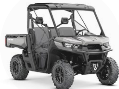
Quad 4x4: Can-Am Traxter 1000 XT