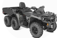
Quad 6x6: Can-Am Outlander 1000 PRO